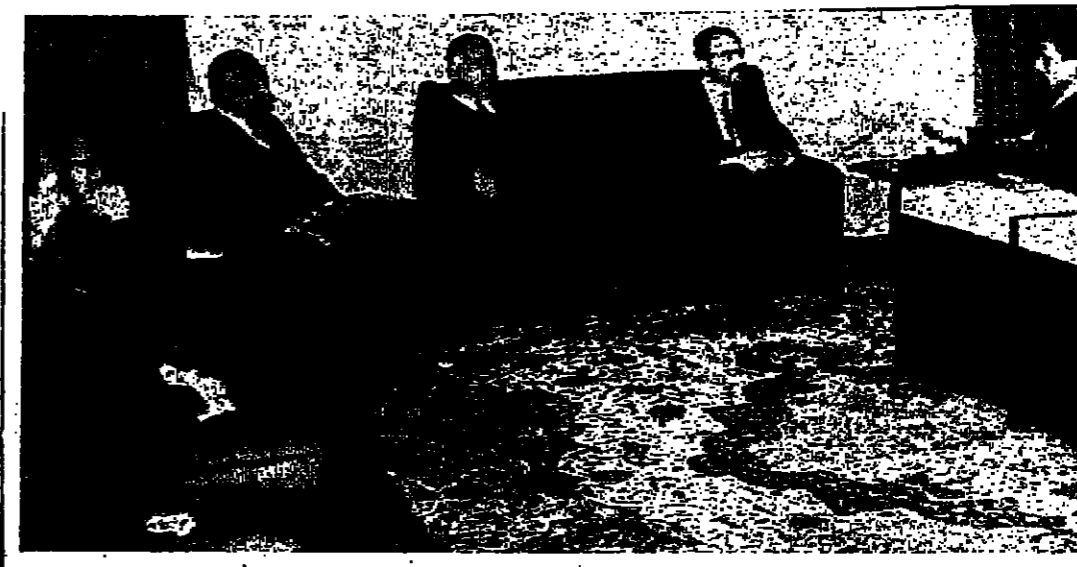
جلالة الملك العظيم يتحدث مع الوزراء العربيين اثناء تشرافهم بالقابلة

الدستور يصدر العدد ٢٢٦ من «الدستور» امس ، تكون قد انتهت السنة الاولى من عمرها في خيمة الرسالة التي صدرت من اجل تنفيذها . وفي الظروف القاسية التي اجتازها الاردن ، والامة العربية ، خلال هذه السنة ، بما في ذلك نكسة حزيران الاسود ، تعتقد «الدستور» انها انت واجهها الوطني والاعلامي على نحو يرضي ضمائر القاطنين عليها ، ويخدم اهداف التحرير والوحدة والحياة افضل ، التي يؤمن بها هذا البلد . ومع اليوم الاول من سنه الجديده ، تعيد «الدستور» ان تواصل بذل ما في وسعها من جهد في خدمة قضايا الوطن والامة ، وان تسعى الى تطوير نفسها - باستمرار - لتواكب القهضة الصحفية الحديثة في العالم .